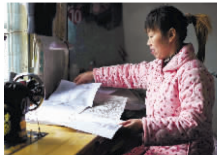
素描的立方体、爬行的乌龟、规整的房子，这是小标的画作。靠缝补度日、生病在家的妈妈经常翻看儿子的画，“觉得开心而安慰”。