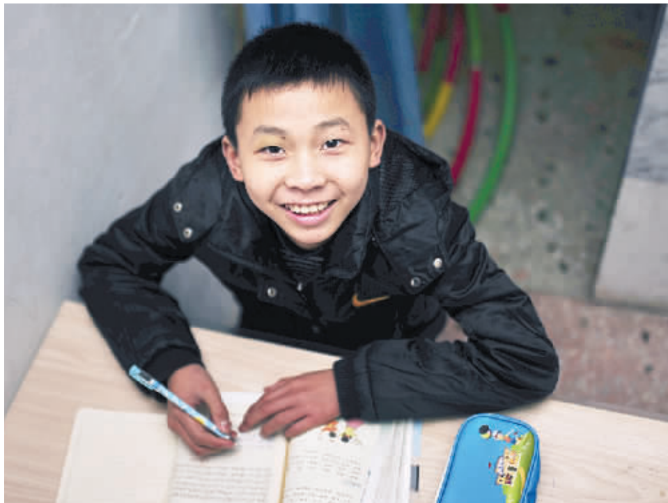
记者跟小标聊起做菜的事，他很开心，“做家务比做作业好玩”。小标从7岁开始就洗衣服、做饭。