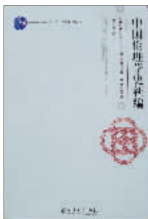
《中国伦理学史新编》 陈少峰 北京大学出版社

近年来，随着中国的强势崛起，人们已经不再怀疑中国经济和政治在世界舞台上所具有的举足轻重的地位。但是，大国的标志不只是经济政治的强大，还有文化的强大。中国文化能否在西方文化占主导的世界格局中有一席之地，是许多人关心的问题。持续多年的国学热，正是国人在文化领域努力探索和重建中国文化的表现。中国文化的核心是中国哲学，而中国哲学的精髓则是伦理学。然而对中国伦理学的研究却处于一种很尴尬的状态。虽然自从蔡元培开始，学者们就开始梳理中国伦理学的独特问题和建构中