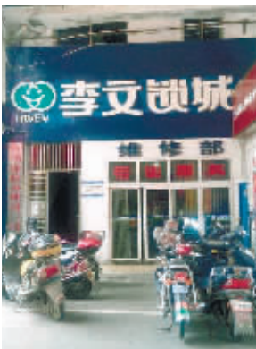
事发的李文锁城店面门口。