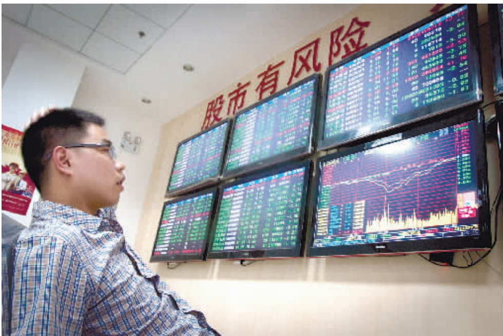
6月25日,沪指盘中跌破1900点,股民在关注行情走势。