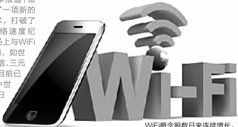
WiFi概念股数日来连续增长。