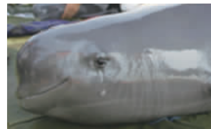
受伤时，它也会“流泪”。