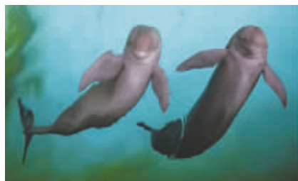
两头江豚在水中跳着“芭蕾”。

其大名叫长江江豚，俗称“江猪子”。成年江豚平均体长120-190厘米，体重约100-220公斤，全身瓦灰色。