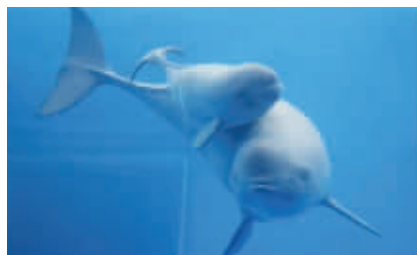
江豚妈妈背着宝宝在水中游。