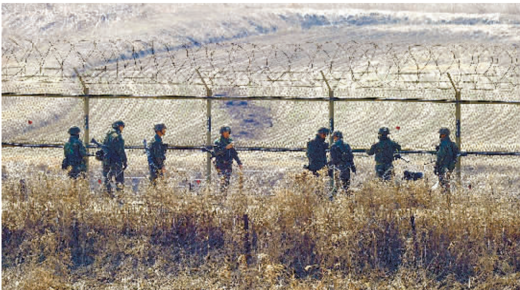
3月27日，韩国士兵在韩国西北部靠近南北军事分界线的坡州市一带查看边境铁丝网。

朝方27日通报说，在战争随时可能爆发的情况下，朝韩双方军队间开设通信线路已变得毫无必要，将从当天起切断这一军事热线，韩方对此作出回应，要求朝方即刻撤回该命令。