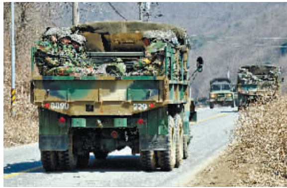
3月27日，在韩国西北部靠近南北军事分界线的坡州市一带，韩国士兵坐在军车上。

韩国军方有消息人士分析认为，朝鲜在切断板门店朝韩联络热线后，又切断了朝韩军事通信线路，这是朝鲜为制造紧张局势所采取的实质性措施中的一环。