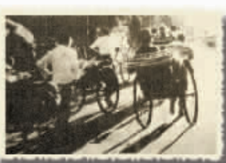
民国时期长沙街头的人力车夫。