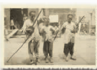
清末长沙街头的吹拉弹打。