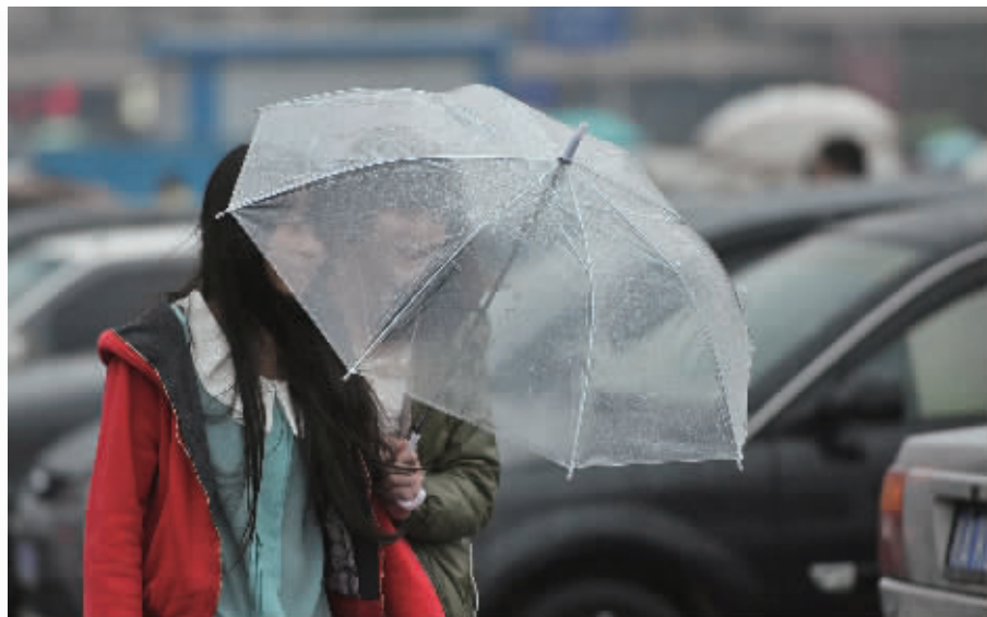
11月9日,长沙火车站前广场。濛濛冬雨中,两个美女撑着透明雨伞迎风前进。