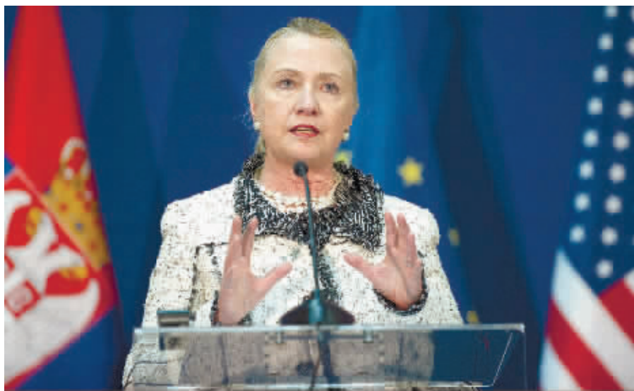
美国国务卿希拉里·克林顿近日在塞尔维亚出席新闻发布会。

此外,美国前总统比尔·克林顿近期在接受媒体采访时表示,他不知道妻子希拉里是否计划角逐2016年的美国总统大选,但希拉里是他所知“全美国最优秀的公仆”,无论希拉里有何决定,他都会支持她。被问到是否觉得希拉里最适合角逐白宫宝座时,克林顿说:“我认为,她是最适合的人选。不过志在担任美国总统的本党(民主党)优秀人士不少。”