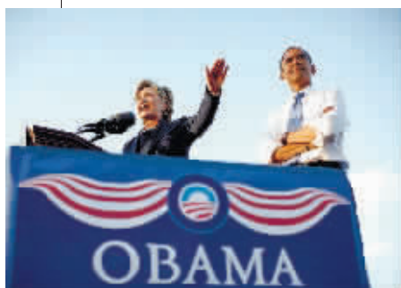
▲2008年10月,希拉里和奥巴马参加竞选集会。

今年8月23日,《福布斯》杂志第九次编制发布全球权势女性榜,希拉里·克林顿位居第二。