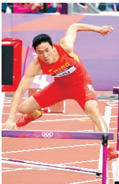
刘翔左脚打栏瞬间。