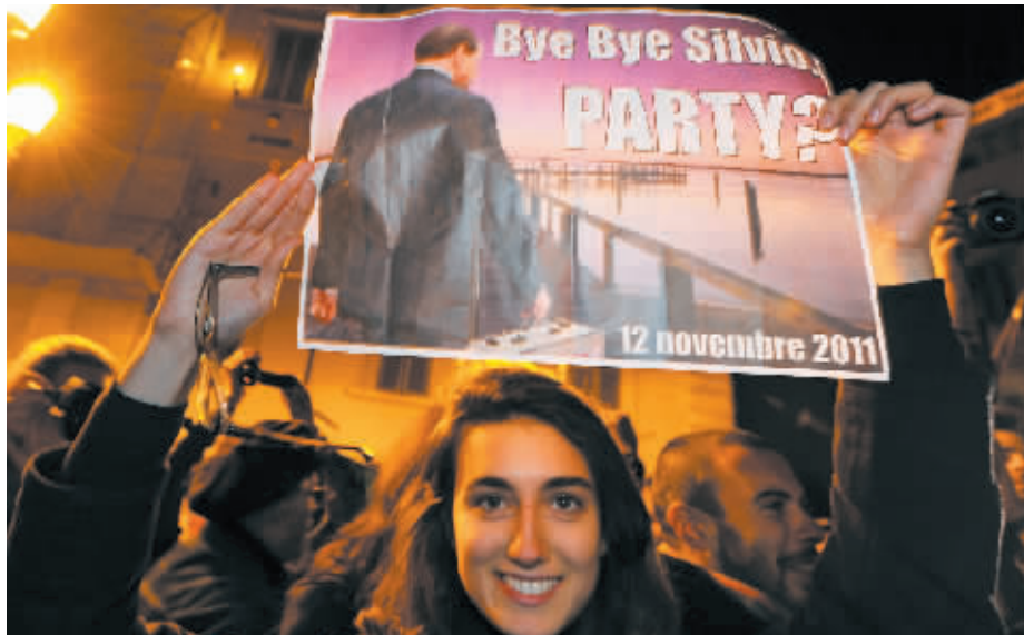
12日，在意大利首都罗马的总统府前，一名女子手持“再见”字样的纸张。