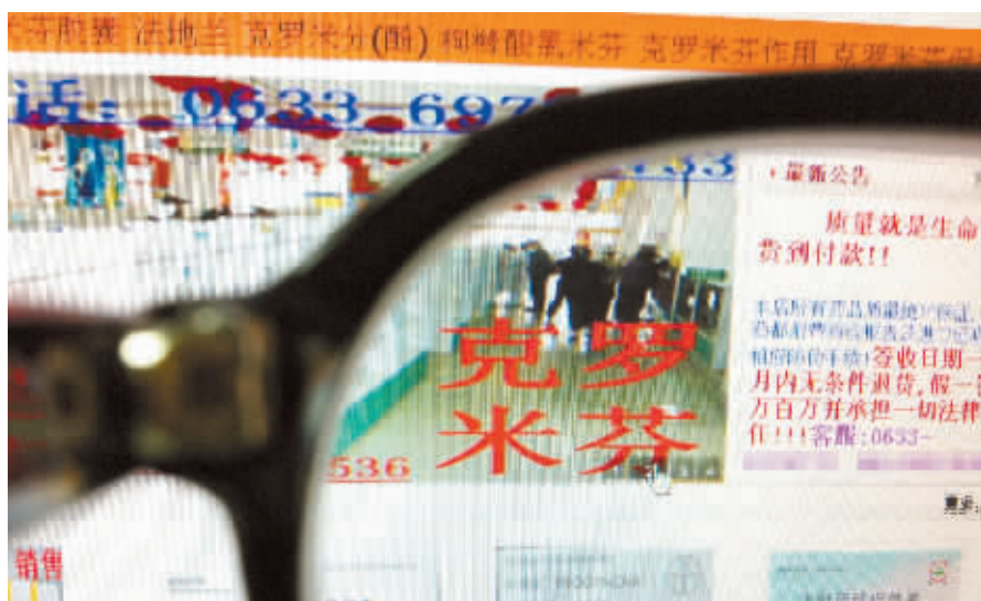
“克罗米芬商城网”首页上销售“多仔丸”的广告。