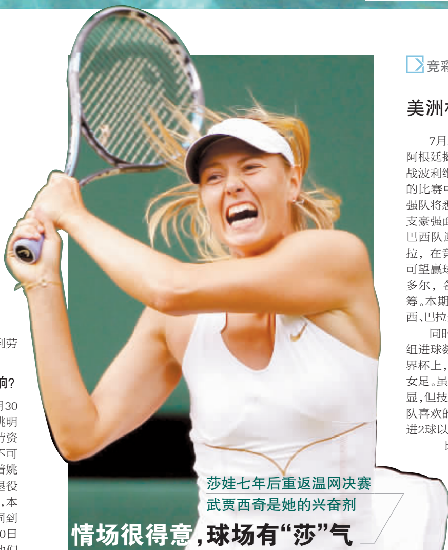
莎娃七年后重返温网决赛 武贾西奇是她的兴奋剂