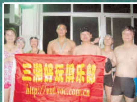
部分参加活动的群友合影。