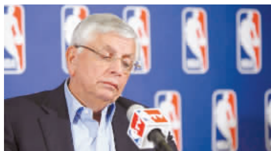
一脸落寞。 NBA联盟总裁斯特恩