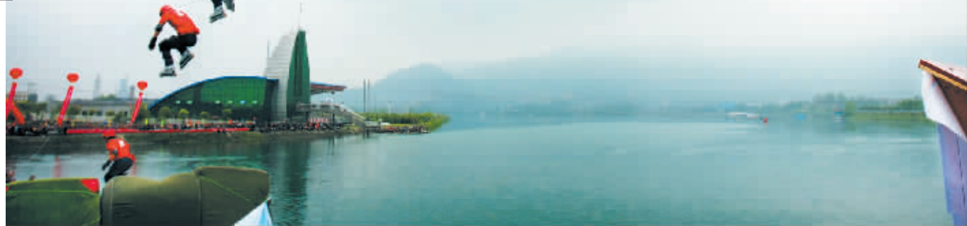
崔文涛成功飞跃20米水面。

选手飞得兴起,观众看得过瘾,老天却并不配合,当崔文涛成功挑战完20米水面,准备向23米距离发起冲击时,天空下起了雨,滑翔台变得湿滑,挑战只能取消,而为了感谢近万名观众的支持,6名不熟水性的选手决定来一次集体轮滑跳水表演,当他们回到岸上时,观众将他们团团围住,要求合影,那阵势,丝毫不亚于一个一线娱乐明星的出行。队中唯一的女将李丽开心地说:“以前也有过很多粉丝支持,但从来没有像今天这么多。” ■记者 蒋玉青