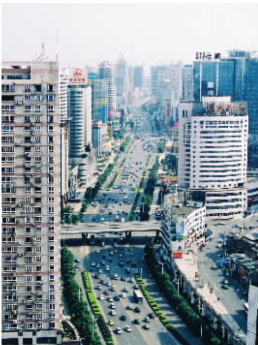
买房该出手时就出手。

一套好的户型设计应该是每个区域合理地进行划分,动静分区、互不干扰。另外,通风能力的好坏是决定户型品质的一个不可忽视的因素。