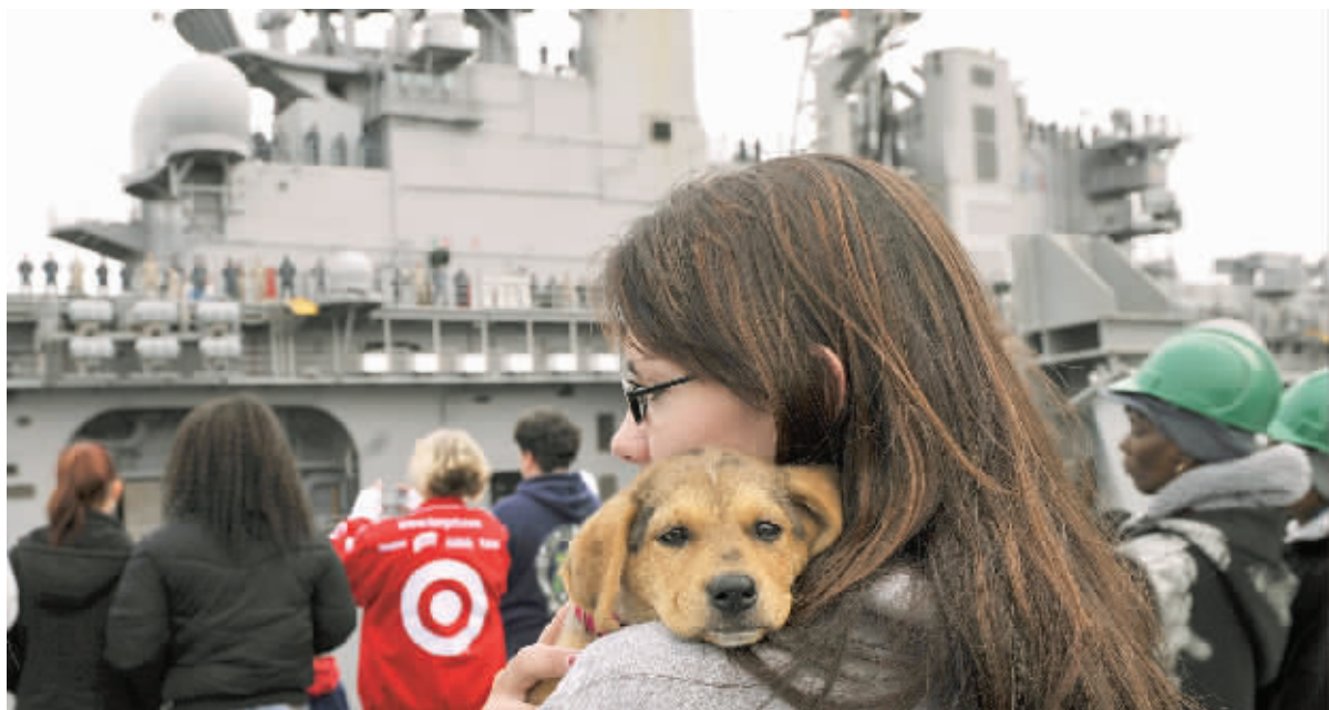
3月23日,美国增派两栖作战舰队,亲人们目送“巴丹岛”号两栖攻击舰离开弗吉尼亚州诺福克海军基地。

据部分西方媒体报道,在西方联军19日发动的首轮军事打击中,一名利比亚飞行员临时改变航线,采取自杀性袭击的方式用飞机撞击了位于的黎波里的卡扎菲驻地阿齐齐亚兵营,导致哈米斯受重伤,并于近日不治身亡。