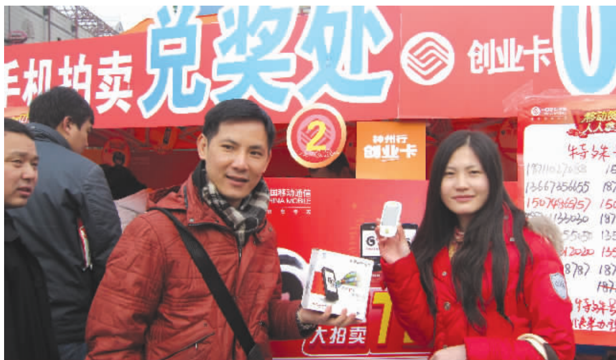
长沙移动手机拍卖现场，一客户成功拍得 G3 手机。