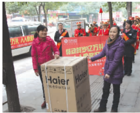
邵阳邵东县移动为喜中一等奖的市民送奖上门。