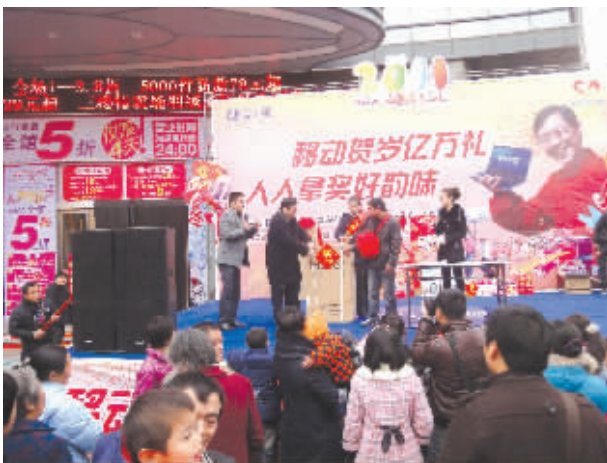
永州冷水滩移动贺岁促销大型抽奖路演活动现场，移动公司为喜中一等奖的客户颁奖。