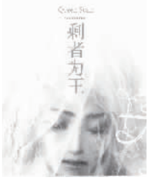
《剩者为王》 落落 长江文艺出版社

“……你在说什么呀！”我浑身发抖，手指在桌子上激烈地找着什么，抓到离自己最近的一盒牙签，干脆利落地把它砸向地面。“不结婚会死吗？不结婚会被判刑吗？也只有你这种人，不歧视会死是吧？我让你觉得难堪是吧？那你放心好了，我会保证你将来一定断子绝孙的！你放心啊，交给我好了！” (3)