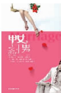
《甲女丁男》 夏景 北京燕山出版社