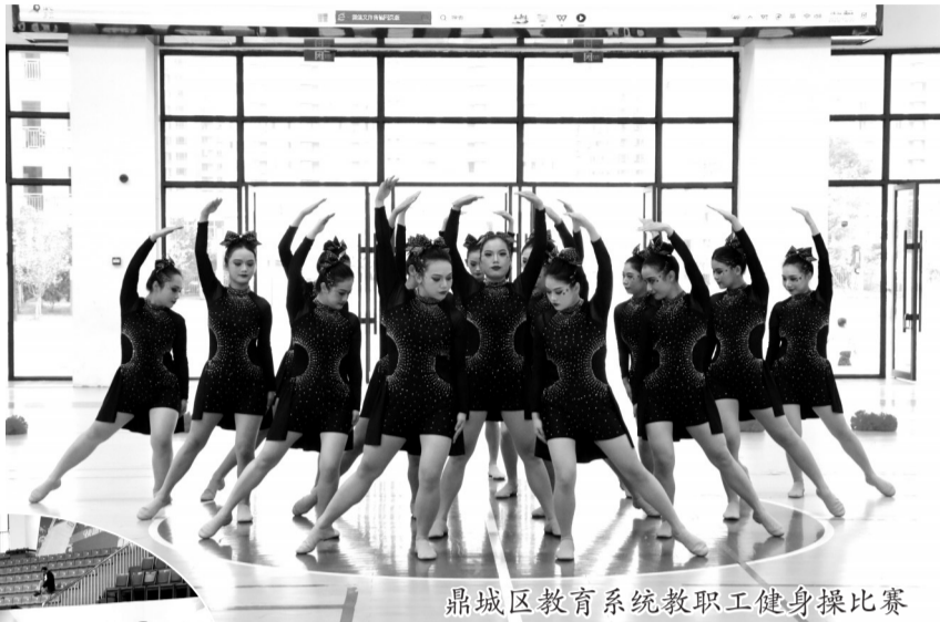
鼎城区教育系统教职工健身操比赛

灌溪中学的篮球场上,“毕业学子 昔日恩师”师生篮球友谊赛同样感人。教师队经验丰富,稳扎