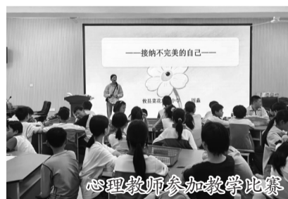
心理教师参加教学比赛

项目负责人介绍,“系统会自动生成‘筛查—评估—预警—干预—跟踪’全链条防护体系。一旦发现预警信号,学校心理老师会第一时间介入。”