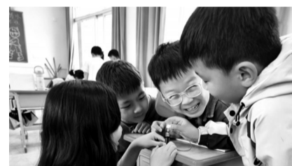
娄底市娄星区黄泥塘中心学校学生进行科创小实验