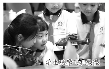
学生观摩飞机模型

“教育,归根结底是要让每一个生命都找到生长的方向。”株洲市渌口区教育局党委书记、局长王宇平表示,“五育融合不是简单的德智体美劳相加,而是要找到它们之间的内在联系,让每个孩子在融合的教育中,成长为最好的自己。”