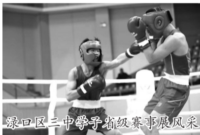
渌口区三中学子省级赛事展风采

建起贯通成长的梦想桥梁。学校构建从小学兴趣班、初中暑期训练营到高中全国传统校联赛的12年成长体系,让热爱篮球的孩子在家门口就能逐梦赛场。“校俱共建”模式形成“白天修学业、课后练技能、周末强实战”的培养机制,让体育训练与学业提升相辅相成。