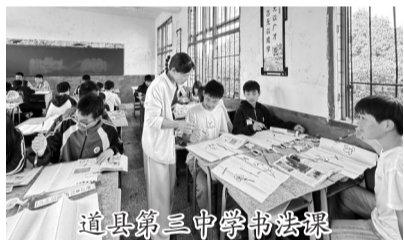
道县第三中学书法课

道县第三中学有一项坚持多年的传统:每学期在校园广场举办主题画展,集中展示学生美术、书法作品。2025年,学校创新推出游园活动,设置投壶、成语接龙、猜灯谜等28个趣味项目,所有项目海报均由美术组教师带领学生共同创作。