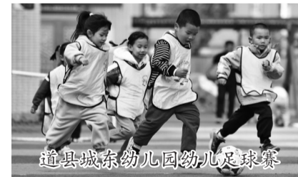
道县城东幼儿园幼儿足球赛

“体育与美育的融合不仅提升了学生的综合素养,更成为心理健康教育的有效抓手。”道县教育局党组书记、局长周明远说,下一步该县将继续深抓学校育人主阵地,引入更多优质教学资源,打造更具影响力的教育品牌样本,让每位学生在阳光运动中强健体魄,在艺术熏陶中涵养品格,成长为担当民族复兴大任的时代新人。