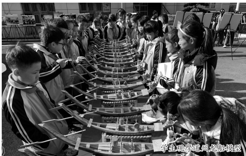
学生观摩道州龙船模型

2026年初,道县第三中学获评湖南省学科美育教学改革试点校。作为一所农村学校,在办学条