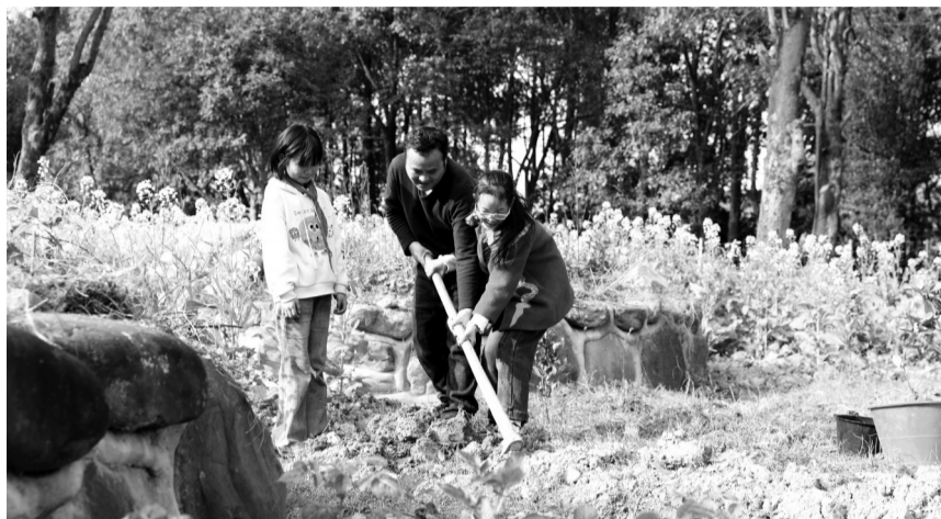
清水坪学校师生在劳动基地里齐栽树苗

鼓、蜡染等非遗展演。全年共组织大型集中展示活动12场次,直接参与学生2200人次,吸引家长志愿者及观摩家长约4.9万人次。学生家庭劳动参与率从两年前的62%提升至87%。