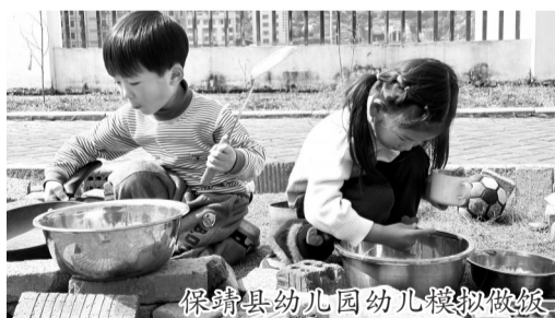
保靖县幼儿园幼儿模拟做饭

2025年5月,第二届少儿村厨社会实践活动中,18支队伍百余位“小厨师”同台竞技,同步进行苗