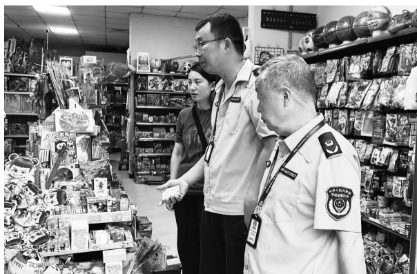
执法人员对学校周边商户进行专项检查

哨声响起,守护即到。在吉首,这不仅仅是一句口号,而是每天发生在129所学校门口的真实故事,是社会各界共同用脚步和汗水写下的平安答卷。