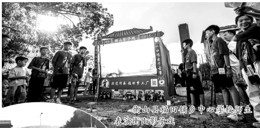
衡山县福田铺乡中心学校师生表演衡山影子戏