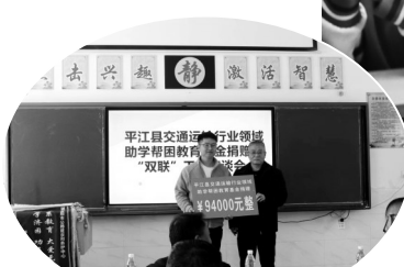
平江县交通运输局送温暖到联点学校虹桥镇天岳中学

的逐步补齐,到协同格局的日益完善,“双联”机制正以全方位、深层次的影响,为平江教育高质量发展注入强劲动力,让每一个孩子都能在安全、健康的环境中成长。