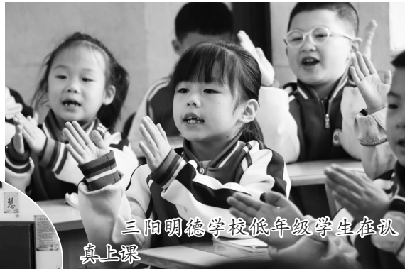
三阳明德学校低年级学生在认真上课

如今的平江校园,育人生态持续优化。在法治素养方面,师生对法律知识的认知深度显著提升,依法维权、守法自律的意识普遍增强;在校园安全环境方面,防欺凌、防性侵、防溺水等专题教育常态化开展,校园安全隐患排查整治形成闭环管理,师生安全感、幸福感持续提升;在协同育人方面,联校领导、法治副校长搭建起家校社沟通的桥梁,打破了以往教育“各自为战”的壁垒,全员、全程、全方位育人的氛围日益浓厚;在学校治理方面,借助联校领导的专业指导与资源优势,学校在教育管理、信息化建设、师资队伍培养等方面获得有力支撑,办学治校