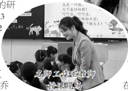
名师工作室教师授课现场