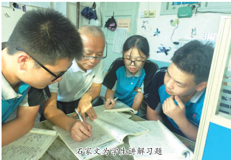
石家文为学生讲解习题