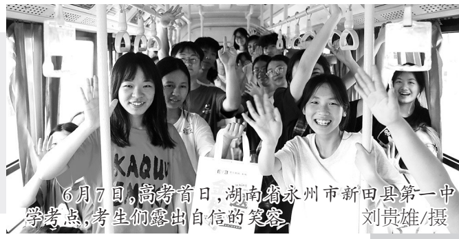
6月7日,高考首日,湖南省永州市新田县第一中学考点,考生们露出自信的笑容

2025年湖南省统一高考科目,即语文、数学、外语,使用全国卷,由教育部教育考试院命题,选考科目由湖南省自主命题。近日,教育部教育考试院发布统考科目的试题评析,本报选登评析内容,以期为未来的考生和相关学科教师指明方向。