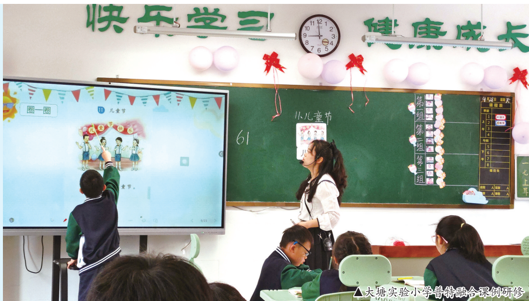
△ 大塘实验小学普特融合课例研修