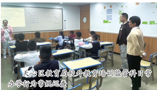
天心区教育局校外教育培训监管科日常办学行为常规巡查