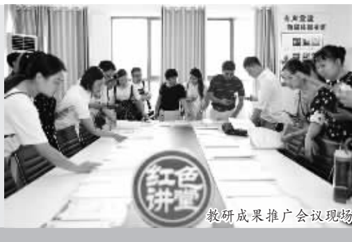
教研成果推广会议现场

“百年大计,教育为本;教育大计,教师为本”。教师是教育的第一资源,是发展教育事业的关键所在。近年来,天元区认真贯彻落实新时代教师队伍建设和改革意见,不断创新体制机制,探索教师培养新路径,激发教师队伍活力,推进教育均衡、协调发展。