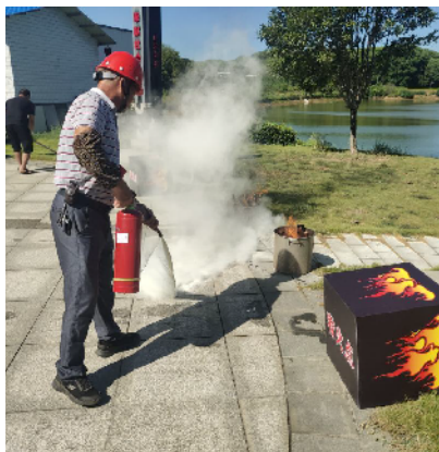
护林员在应急演练中操作干粉灭火器灭火。

员，我将严格遵守大泽湖街道护林防火工作的相关规定，对责任区域加强巡查管护，认真履行森林防火职责。