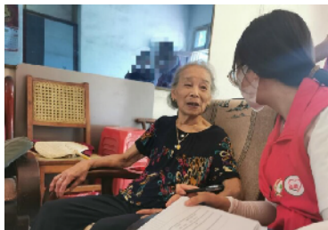
志愿者慰问社区老人。

本报讯（通讯员 肖英 谢婷）为弘扬中华民族尊老爱幼的传统美德，进一步倡导敬老、爱老、助老新风尚，8月31日，长沙市开福区捞刀河街道金竹河社区联合湖南省点爱社会工作服务中心开展“秋日迎清风 关怀寄心房”慰问高龄老人、低保重疾家庭志愿行活动。 在看望低保重疾家庭的过程中社区“两委”干部和点爱社工耐心陪老人聊天，并详细询问他们的生活、饮食、身体等情况，提醒他们根据气候变化注意随时增减衣服，饮食清淡，日常生活中多注意安全。看到他们笑容满面，精神状态良好，大家都很高兴。