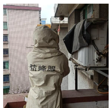
工作人员正在清理马蜂窝。

本报讯（黄亚辉 通讯员 全佳乐 余红梅）“我是西湖新村4栋的小区居民，我们有困难想找社区帮忙解决……”3月31日，衡阳市石鼓区青山街道西湖新村社区新时代文明实践站接到居民的求助电话。原来，西湖新村4栋7楼的房檐下有一个直径20多厘米的马蜂窝，并且时有马蜂出现，马蜂窝的下方摆着居民平日下棋休闲的桌椅，周边居民每天都提心吊胆，害怕被马蜂蜇。为尽快消除隐患，避免马蜂蛰