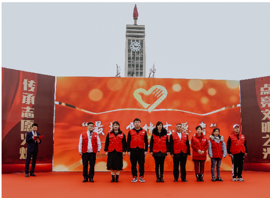
最美雷锋志愿者获奖者。

近年来，芙蓉区以实际行动贯彻落实习近平总书记关于将志愿者事业同“两个一百年”奋斗目标、同建设社会主义现代化国家结合起来这一要求，一手抓雷锋志愿者队伍和道德典型，一手创新志愿服务载体，策划了“文明实践365”等志愿服务项目，共有各类雷锋志愿队100余支，注册雷锋志愿者8万余人，用义行善举让星城长沙变得更有