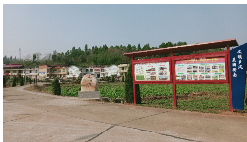
乡村文化长廊，传播社会正能量。

为了进一步巩固和深化文明创建活动成果，泉湖镇着力抓好社会主义核心价值观宣传教育，通过送文化下乡、屋场恳谈会、党员活动室、广播