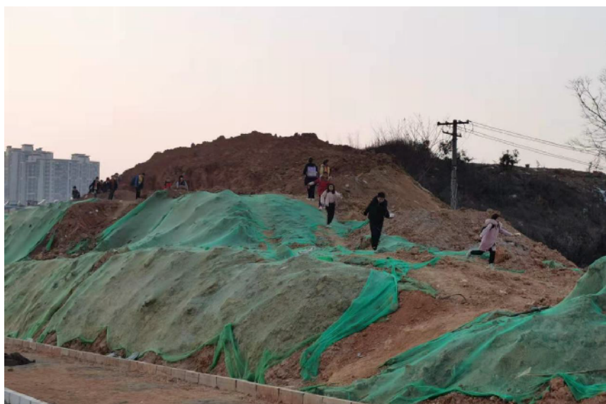
放学后，小学生在工地上玩闹。

如果你孩子上下学的必经之路，有一块建筑工地正在施工，而且完全没按要求增设围挡，孩子们放学后喜欢跑到这个工地上玩耍嬉戏。作为父母的你，是不是会担心孩子在此发生安全事故，从而提心吊胆？近日，就有不少提心吊胆的父母就此事致电《金鹰报》，说在长沙市雨花区东二环与长沙大道交会处东南侧有个楼盘无围挡施工数日，而且现场无任何警示标志和遮挡物，安全隐患非常大。据了解，该工地为旭辉国悦府的售楼部和楼盘工地。1月18日，记者前往该楼盘施工现场调查情况。