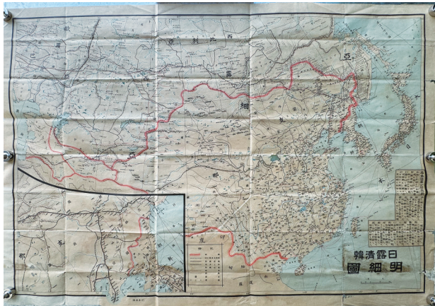
上图:首度公开的高精度原版《白露清韩明细图》。