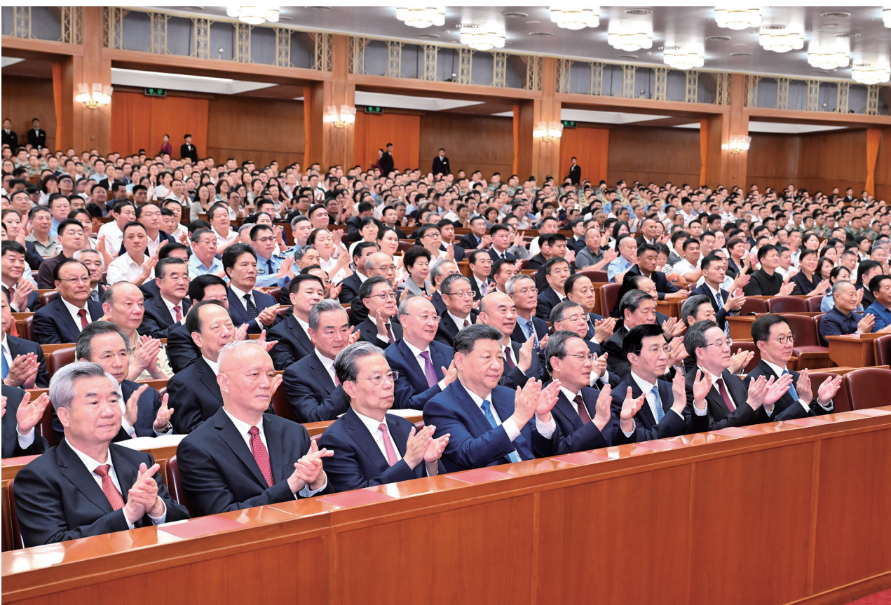
6月29日晚，庆祝中国共产党成立105周年音乐会《人民至上》在北京举行。习近平、李强、赵乐际、王沪宁、蔡奇、丁薛祥、李希、韩正等党和国家领导人，同约3000名观众一起观看演出。

新华社北京6月29日电 深情乐章致敬辉煌历程，嘹亮歌声唱响人民史诗。庆祝中国共产党成立105周年音乐会《人民至上》29日晚在京举行。习近平、李强、赵乐际、王沪宁、蔡奇、丁薛祥、李希、韩正等党和国家领导人，同约3000名观众一起观看演出，共同庆祝这个光荣的节日。