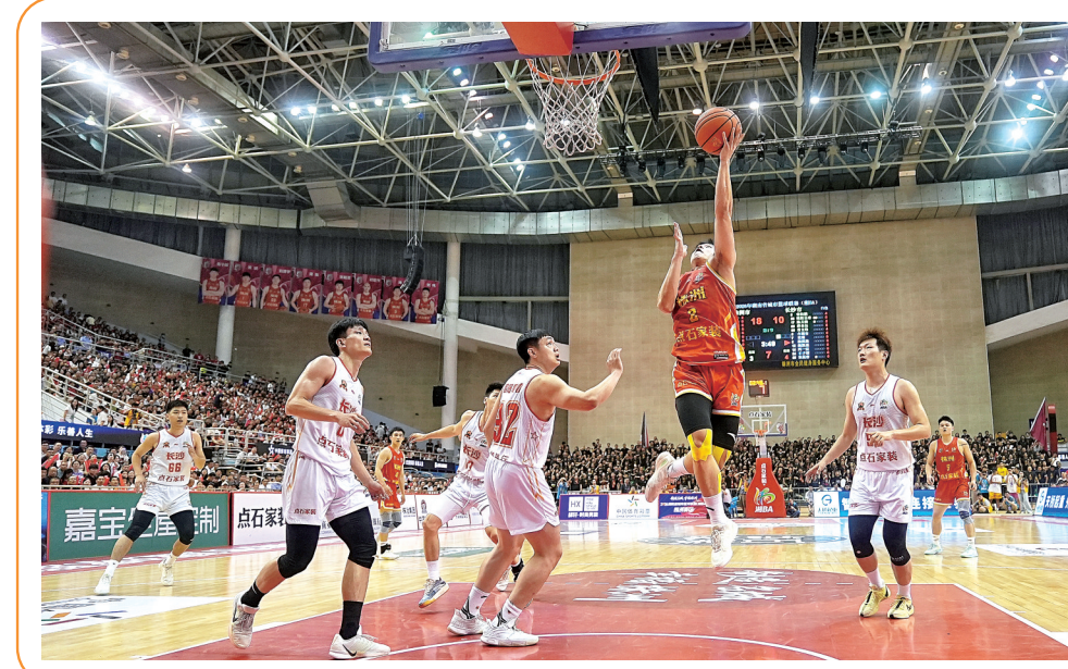
株洲队问鼎 “湘BA”总冠军

及大张家界旅游区的69家优质商户。其中，湘潭本土35家、株洲14家、长沙8家、常德、邵阳、张家界等地12家商户联袂登场，呈上一场覆盖三湘四水的地道风味盛宴。从刮凉粉、酱板鸭、葱油地锅粳等街头小吃，到茶油、香干等特色农产品，再到湘潭“苍蝇馆子”主打菜品与精品咖啡饮品、琳琅满目的展销产品，让游客“一站式”尝遍湖湘美味。 ▶▶(下转8版④)