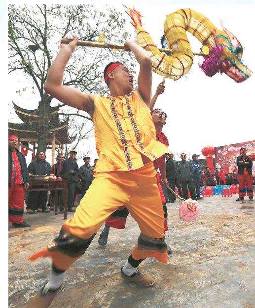
国家级非物质文化遗产代表性项目龙舞(芷江孽龙)。(资料图片)

循一缕暗香，奔赴芷江。 清乾隆元年(公元1736年)，湖南巡抚钟保上奏朝廷，称沅州“地处边陲，最为紧要”，恳请升州为府。乾隆准奏，可附邵阳县(与府城同处一城的县城)该取何名?据传，朝中御史进言，沅水两岸遍生芷草。乾隆忆起屈子诗“沅有芷兮澧有兰，思公子兮未敢言”，当即赐县名——芷江。 沅水之滨，岸芷汀兰，因屈子诗文，芷草飘香了两千年。直至上世纪20年代，青年沈从文寓居芷江，才在《湘行散记》里细致描摹出它的模样：“生长在悬崖隙隙间，或蔓延到松树枝杈上，长叶飘拂，花朵下垂成一长串，风致楚楚，花叶形体较建兰柔和，香味较建兰淡远。” 而今，芷草在人们口齿间芬芳，在口耳相传的“嘎小贵”(侗语：回家吃饭)餐厅，芷江鸭制作技艺国家级非物质文化遗产传承人杨才华，捧出几片芷草，称这是芷江鸭的灵魂草。食客围立桌旁，看那只本地散养的鸭子，如何在两三片芷草的点缀下，摇身变为据说连屈原和乾隆都称赞的美味。芷江鸭，不仅是当地待客的主菜，每天还有数百只飞向大江南北的餐桌。 山下十万坪侗寨的沅州石雕传习基地，百余盆兰草摇曳生姿。国家级非物质文化遗产代表性项目沅州石雕的国家级代表性传承人胡杨正悉心指点弟子。这项技艺始于南宋，温润如玉且色彩丰富的石料就产自明山，匠人根据石料天然的纹理和颜色进行创作，名曰俏色巧雕，每件都独一无二。胡杨和妻子张小花带徒弟，编图书，做直播，兰草的香和十余箱精致的雕，悄然拂去了他们对收益的担忧。 走进始建于北宋熙宁七年(公元1074年)的芷江文庙，荷花池小学和芷江一中的琅琅书声穿墙而来，崇圣祠后方，一栋朴素建筑便是沅水校经堂旧址。它与长沙湘水校经堂齐名，培养过熊希龄、张学济、陈瓊珍等众多英才。抗战时期，这里还曾作为中央陆军大学分校。桃李芬芳，文脉绵长。 夕阳西下，在七里桥边的受降纪念馆旁，人们