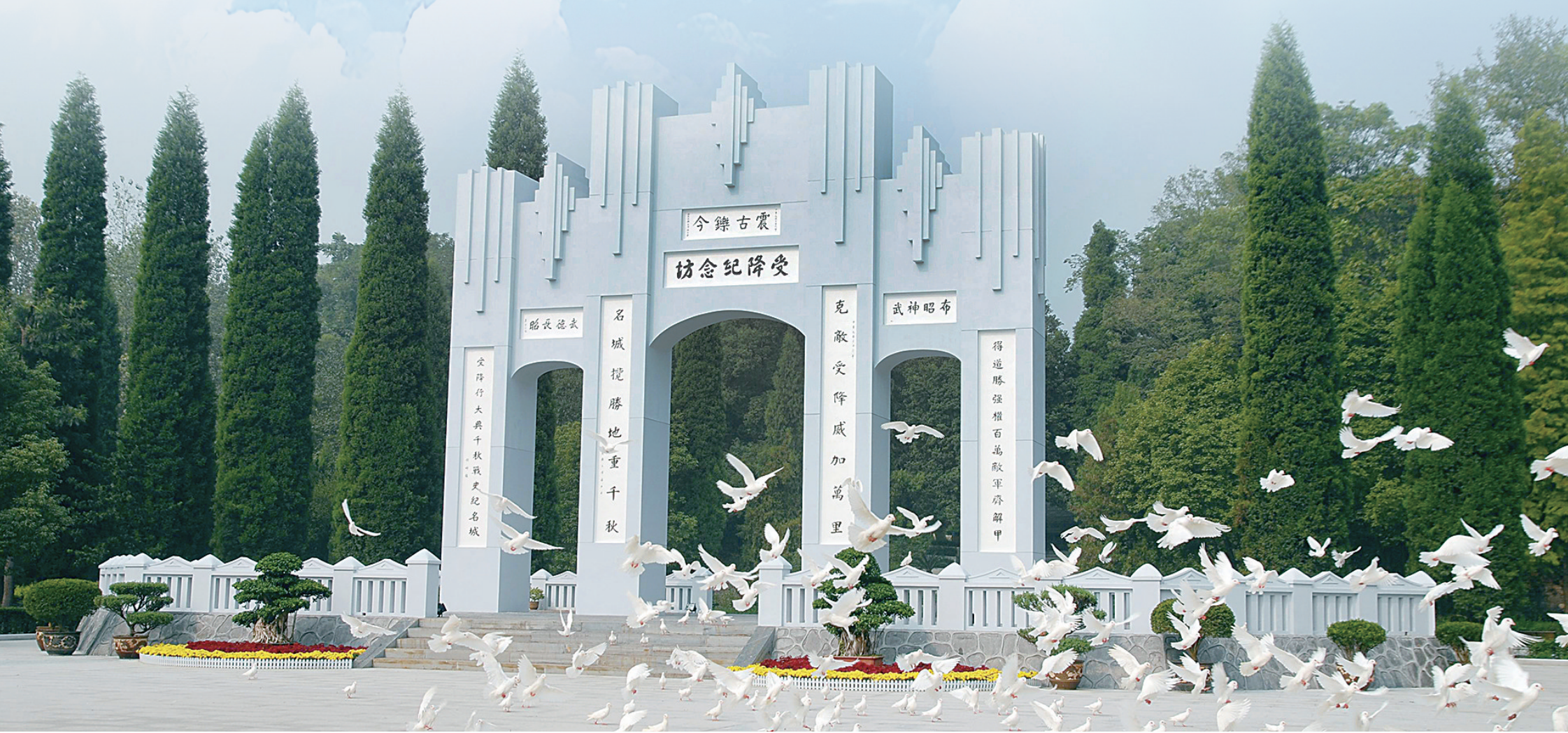
位于芷江侗族自治县七里桥的受降纪念馆。