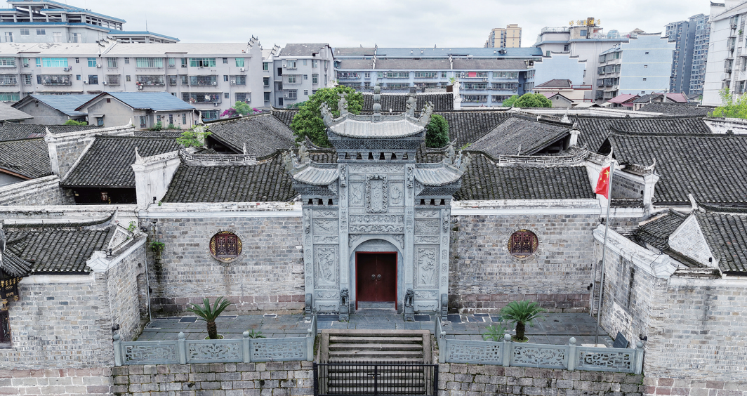
5月14日，芷江侗族自治县天后宫。