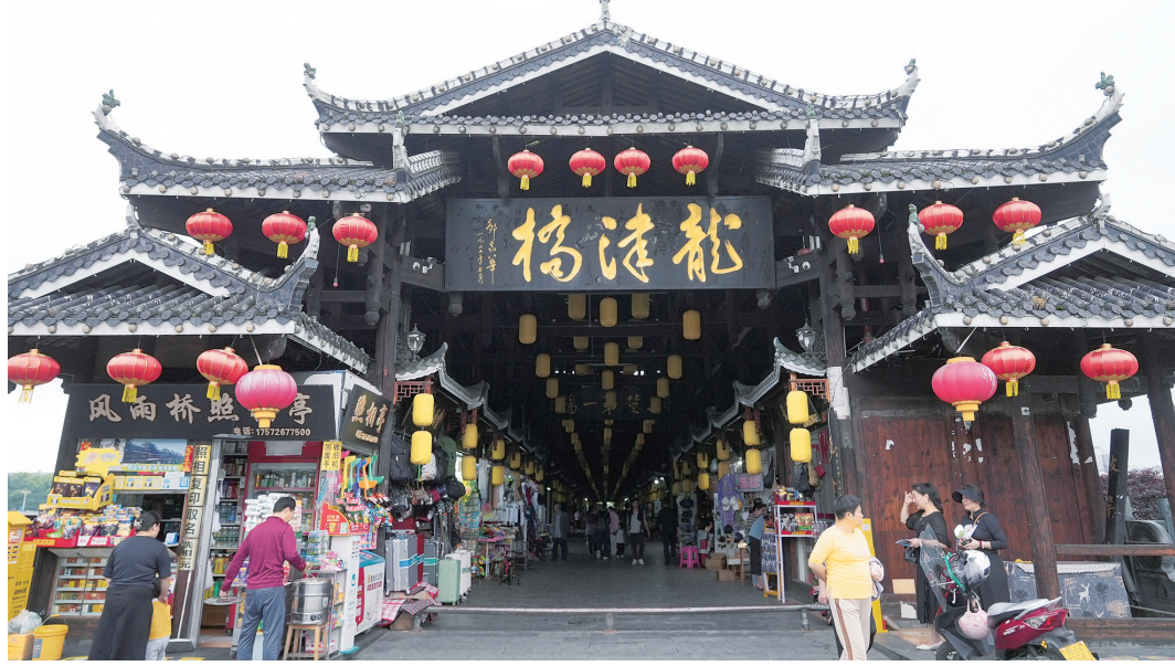
芷江侗族自治县龙津桥。

每逢端午，溇水上，龙舟下水打锣鼓，龙津桥上，观赛者人声鼎沸。 龙津桥，长246.7米，如蛟龙飞跃溇水之上，有“世界最长风雨桥”之誉。明万历十九年(公元1591年)，僧人宽云四处募捐，在沅水驿旁的西关渡口修成此桥。从此，人们往来沅黔孔道再无过渡之苦。 历经四百余年沧桑，16座舟形石墩在溇水中竖如磐石，远望如龙舟竞渡。桥上建筑于1999年修复，融侗族建筑的长廊、凉亭、鼓楼于一体，不用一钉一铆，榫卯相衔。今日，人们往来在龙津桥上通行、休闲、经商。 龙津桥西端，连着黄甲街。街因宋徽宗宣和六年(公元1124年)沅州籍士子“榜五进士”而得名。有了龙津桥，宋时就是驿路的黄甲街更是商贸云集。清代修建的五福宫(宝庆会馆)至今尚存。门联(邵阳)人的拼搏和乡愁。1935年年底，红六军团长征过芷江，在此设立指挥部。 四方商贾奔赴芷江，逐梦谋生。北芷街编起广东会馆，江西新建起万寿宫，溯江而来的福建客商，则兴建了天后宫(福建会馆)，面积达3700平方米，是内陆最大妈祖庙之一。 “每一座会馆，都是一个商人集团的形象代表!”4月25日，著名古建筑保护专家柳肃乘舟而至，驻足天后宫前。这位在央视《百家讲坛》和B站上讲过无数国宝级古建筑的专家，仰望眼前“全国少有，非常精美”的石坊原物，语气里仍透着兴奋。 天后宫始建于清康熙年间，随着福建客商日渐增多，他们在清乾隆十三年(公元1748年)扩建天后宫，并修建了金石牌坊。石坊高10.6米，宽6.3米，大小浮雕95幅。 “这两幅风景雕刻最是独特!”柳肃指引记者细看。一幅是泉州洛阳桥，泉州是福建商人的家乡，也是他们水路经商的起点。石壁上“泉州府”三字清晰可辨。另一幅是武汉三镇，尺寸仅0.216平方米，光船就只有102艘。当年福建人从泉州出发，沿海北上，从上海入长江，武汉三镇是他们最重要的中转站，再经洞庭湖溯沅水到达芷江。他们运来沿海特产，又将湘西木材和桐油远销四方。 抗战时期，小城接纳了220个军事机构。先是苏联援华航空队来了，他们住在环球旅社，早上在七里桥跑步。接着，飞虎将军陈纳德带着他的德国爱犬乔，率美国陆军第十四航空队，中美混合联队外的，6000余名美军官兵聚居于此。竹坪铺、东门外的街巷，弹药库、影院、医院、招待所、修理厂、礼堂、加油站等齐全，绵延近两公里，芷江人称“美国街”。 听过俄罗斯《喀秋莎》忧伤深情的旋律，见过来自大洋彼岸热情洋溢的舞蹈，山谷里的流水依然平静奔流。你不用惊讶，在芷江，鼓楼、寺观和教堂和谐共处，侗族吊脚楼和厅厅式民居，商帮客子屋交臂共生。 在芷江，文化的融合是那样自然。国家级非物质文化遗产代表性项目龙舞(芷江孽龙)，舞的是中国最小的“龙”，龙全长不足三米，龙头、蛇身、凤尾，舞龙时两人即可。传说这位“南海龙王”，性情暴躁但心地善良，常为百姓驱灾镇邪。芷江人肯佳节都要舞起它。不知从何时起，源自隋末唐初的侗族“孽龙”舞进了汉族的长龙队伍中，既和谐又耀眼。 在吴和平看来，芷江人对外来文化的包容是刻在基因里的。本地侗族源自古百越族群，千百年间与多民族交流融合。他们的先祖来自东方，侗歌中代代传唱：东方人兴起，西方人来往，来了三姓不知，五姓不难，合在一起，聚在一团，团成一寨，喜笑同乐，外患同忧…… 海风山月，就这样在芷江和而不同，美美与共。