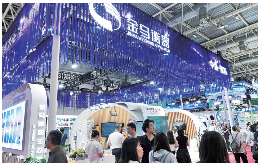
6月23日,湖南金马衡器有限公司等8家企业作为绿色农业链企业亮相链博会。

“原有业务我们会继续做得更大、更精、更细,与此同时,我们也在积极开拓新的增长点。”蓝思科技中国区总裁江南介绍,公司利用在材料加工和精密制造方面30多年的技术积累,向新领域拓展,在AI智能终端、AI服务器、商业航天、半导体封装等领域,都已跑到全行业前列。