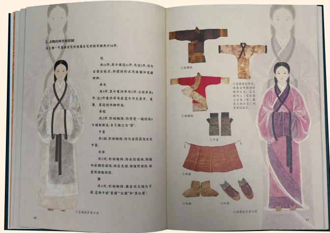
《写给大家的考古报告：长沙马王堆汉墓》内页。

她为什么能保存得如此完好？书中归结为三个关键词：深埋、密封、防腐。墓室深埋、椁室构筑严