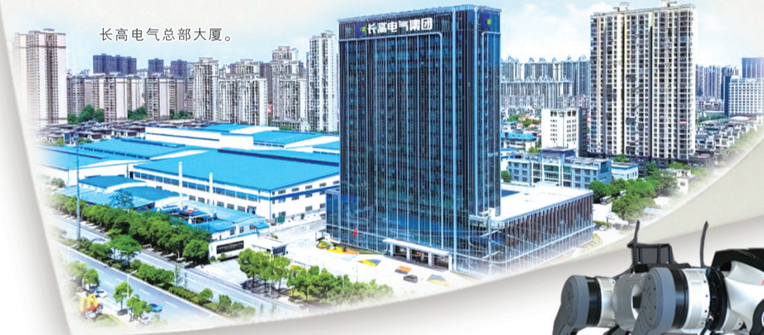
长高电气总部大厦。

立足千亿级新起点，当以何种姿态踏上“十五五”新征程？牢牢把握高质量发展首要任务，因地制宜发展新质生产力——望城经开区将科技创新作为引领未来、跨越发展的关键一招。