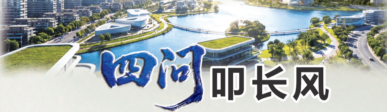
望城经开区科创示范区概念图。

2025年，全年新增规模以上工业企业22家，国家级专精特新“小巨人”企业4家，省级以上专精特新中小企业45家；高新技术企业净增58家，总数达430家；9家企业获评制造业质量标杆，约占全省1/9，创新活力在经营主体中充分释放，为园区高质量发展积蓄源源不断的内生动力。