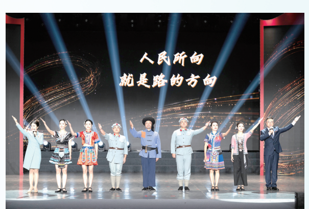
6月18日，2026年度湖南省国资委系统“弘理强企‘典’亮时代”党的创新理论宣讲比赛决赛中，湖南高速集团宣讲现场。(资料图片)

双牌合璧：信仰的力量，从何而来 “十五五”开局，国资国企面临着怎样的时代命题？ 国际环境复杂严峻，国内经济承压前行，新一轮科技革命和产业变革加速演进。对湖南国企而言，既要应对外部不确定性，又在深化改革中啃下“硬骨头”——优化国有经济布局、培育新质生产力、提升核心竞争力，每一道都是必答题。 回答这些命题，需要方向，更需要信仰。 “党课开讲啦”自2020年由中央组织部部署开展以来，已成为党员教育的特色阵地。2026年度湖南省国资委系统“党课开讲啦”围绕思想引领、党性融合、先锋榜样和党风优良四大主题，着力打造“红擎领航 奋楫湖湘——党课开讲啦”微党课党员教育品牌。 “弘理强企‘典’亮时代”党的创新