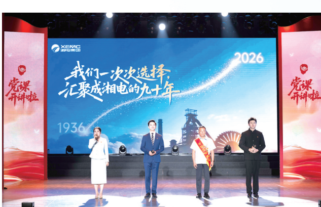
6月18日，2026年度湖南省国资委系统“党课开讲啦”比赛决赛中，湘电集团登台展示。(资料图片)

6月18日，湘潭，湘电集团千人礼堂座无虚席，气氛热烈。 这是2026年度湖南省国资委系统“党课开讲啦”暨“弘理强企‘典’亮时代”党的创新理论宣讲比赛决赛现场。历经初赛、复赛层层选拔，16支来自省属监管企业、中央在湘有关企业、市州国资委的参赛队伍齐聚伟人故里同台竞技。 2026年，恰逢中国共产党成立105周年、红军长征胜利90周年，亦是“十五五”开局、新一轮国企改革起步之年。在承前启后、继往开来的历史交汇点，这场从初春燃至盛夏的思想盛会，迎来了最高潮。