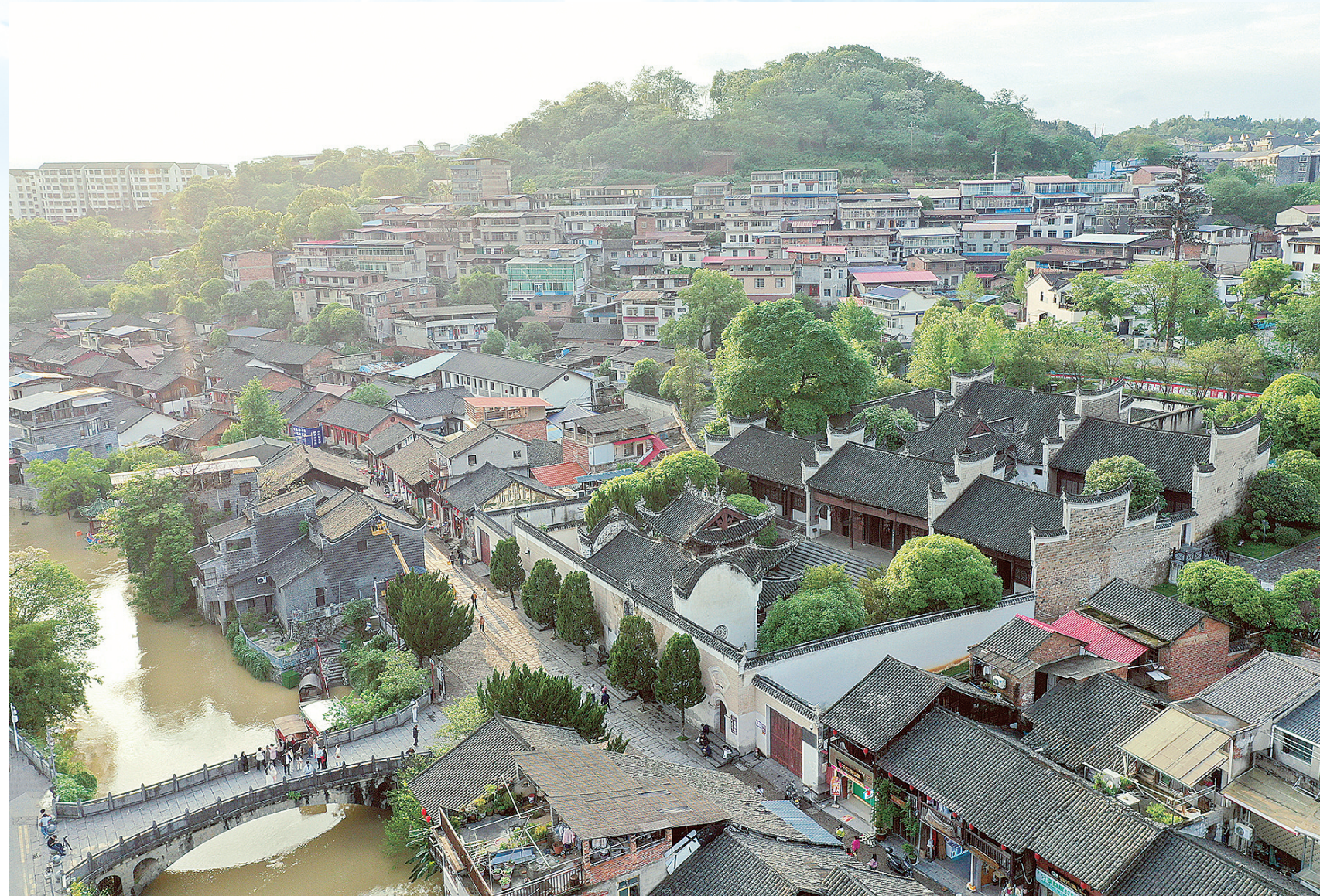
4月29日，永州市零陵区柳子街。