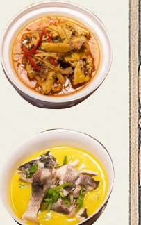
4月28日，柳子家家宴部分菜品。

两千余载，历代名贤在此往来栖居，以风骨立世，以笔墨传情，一脉文心生不息，让零陵成为潇湘大地跨越时光、韵味绵长的文化地标。