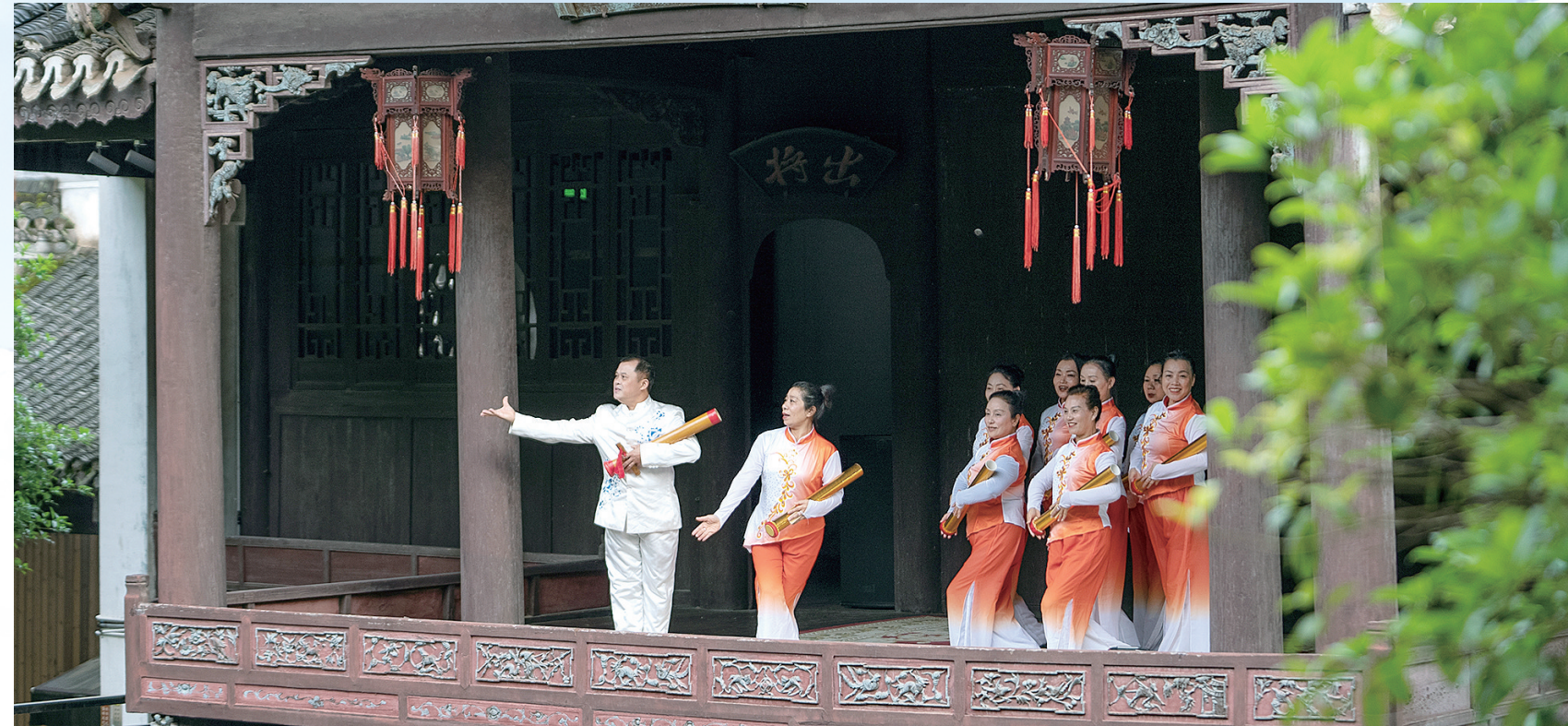
4月29日，零陵渔鼓表演。