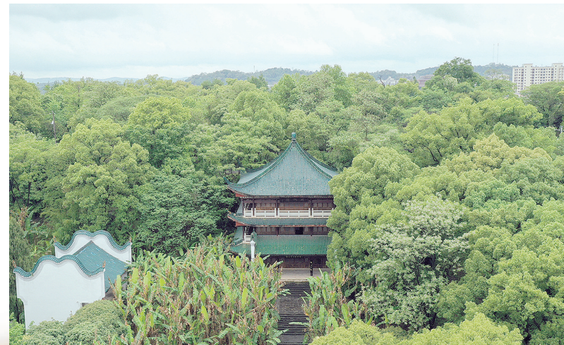
4月29日，永州市零陵区怀素公园。

柳子庙坐落于潇水西岸，现为零陵区柳宗元纪念馆，既是全国重点文物保护单位，亦是湖南省爱国主义教育基地。零陵“探寻柳子足迹”实景研学项目，入选“2024年全国文博社教案例宣传展示活动”百项创新案例。