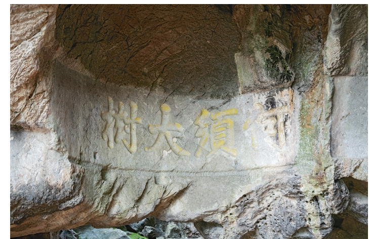
4月30日，位于永州市零陵区朝阳岩的摩崖石刻。

从静态守存到动态传承，从文化资源到发展动能，零陵实现古城保护、文脉发展的双向赋能、迭代跃升，并用实践证明了守护文物遗存，贵在留住市井烟火；赓续千年文脉，重在实现古今交融。